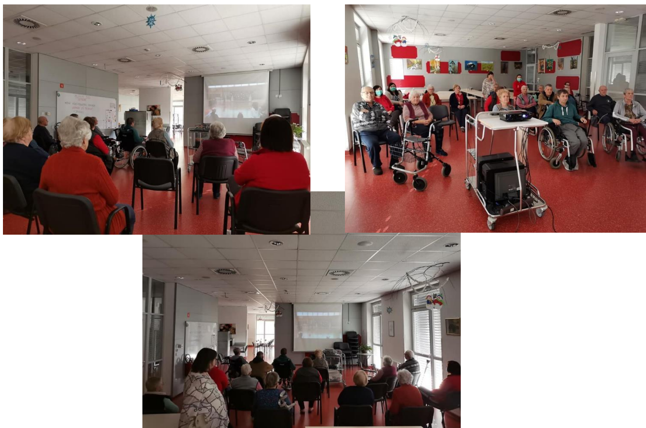
OSKRBOVANCI DOMA STAREJŠIH IDILA MED OGLEDOM PROSLAVE

Želeli smo, da so del te proslave tudi oskrbovanci doma starejših Idila, zato smo jo posneli in poslali v dom starejših Idila. Na tak način so si lahko poleg proslave ogledali tudi, kakšna znanja in talente imajo naši učenci in učenke.