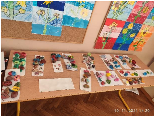
KAMENČKI UČENCEV OŠ PESNICA IN PODRUŽNICA PERNICA

Skupaj z delavci naše šole in doma starejših smo se odločili, da bomo obeležili mednarodni dan prijaznosti. Kljub razdalji smo želeli drug drugemu polepšati dan. Oskrbovanci doma in učenci so pobarvali kamenčke, ki so jih kasneje okrasili in nanje zapisali lepo besedo ali misel. Učenci so ob ustvarjanju kamenčkov izredno uživali in nestrpno čakali, da prejmejo kamenčke oskrbovancev doma starejših Idila.