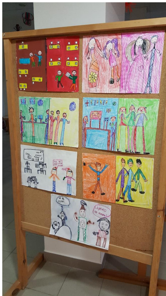
Razstava likovnih del